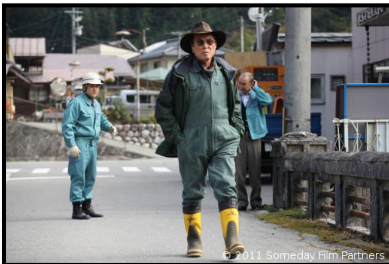
Yoshio HARADA interprétant le rôle de Zen dans le film Someday

Enfin, lors de la cérémonie de clôture, l'association KINOTAYO a souhaité rendre hommage en évoquant la disparition de l'acteur Yoshio HARADA . Un grand interprète au charisme légendaire dont la popularité ne s'est pas démentie pendant plus de 40 ans de carrière.