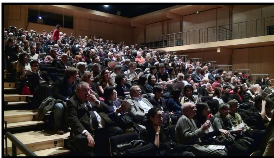
Spectateurs présents à la Cérémonie d'ouverture

Plus de 4 800 spectateurs ont fait le déplacement pour venir assister aux séances, soit une progression de 12% pour un nombre de projections en réduction. Ils sont la preuve qu'il existe une attente et un véritable intérêt pour le cinéma japonais contemporain en France.