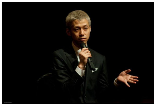
Yoshihiro FUKAGAWA "Into the White Night"