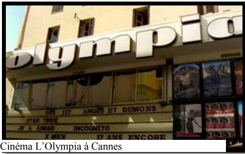
Cinéma L'Olympia à Cannes

Parmi les indispensables, il faut également tenir compte de toutes les salles de cinéma partenaires. En premier lieu, la Maison de la Culture du Japon à Paris, la salle pivot. Une dizaine de salles réparties dans toute la France ont également contribué à la programmation des films de la sélection et cela malgré une concurrence presque « intouchable » en cette saison.