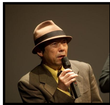
Hitoshi YAZAKI "Love and Treachery"

A chaque fois, des rencontres avec le public ont été organisées lors d'une projection. Des échanges très attendus par les spectateurs et les réalisateurs qui ont l'occasion, souvent pour la première fois, de recueillir les impressions du public français.