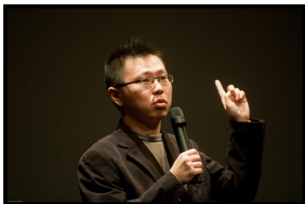
Ryô NAKAJIMA "When I Kill Myself"