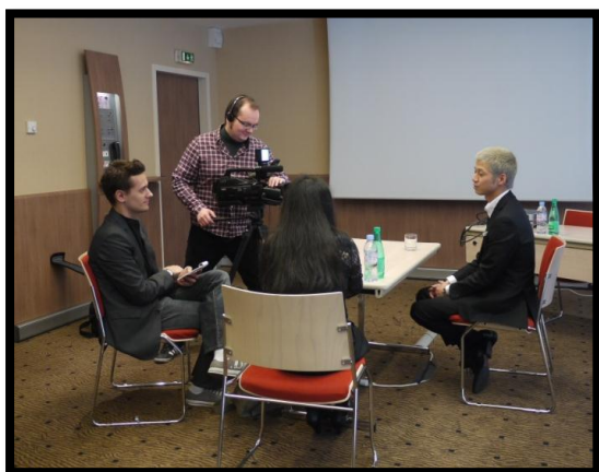
L'équipe KINOTAYO lors d'une interview avec le réalisateur Yoshihiro FUKAGAWA

Une centaine d'articles ont été postés sur le net (East Asia, Salles Obscures, Total Manga, Film de Culte,...), publiés dans des magazines de la presse écrite (Cahiers du cinéma, Japan LifeStyle, Pariscope, Paris Match...) et deux émissions ont été diffusées sur des chaînes de télévision (LCI et No Life).