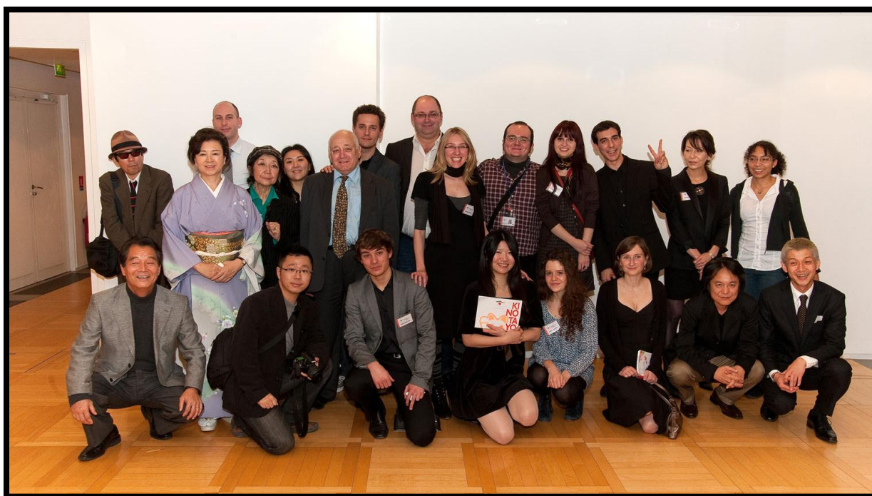
Une partie de l'équipe KINOTAYO avec les réalisateurs

Pendant toute la durée du festival, une dizaine de bénévoles se sont joints aux organisateurs afin de pouvoir accueillir et encadrer au mieux les spectateurs et les réalisateurs.